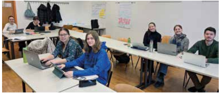
Gemeinsames Schreiben in der LV am 26. Jänner 2026

Viele Studierende verwenden KI täglich, und zwar bei Aufgaben wie dem Erstellen von Zusammenfassungen, der Recherche, der Verbesserung selbstverfasster Texte oder dem Übersetzen komplexer Textabschnitte. Sie begründen es mit Effizienzsteigerung und meinen, dass