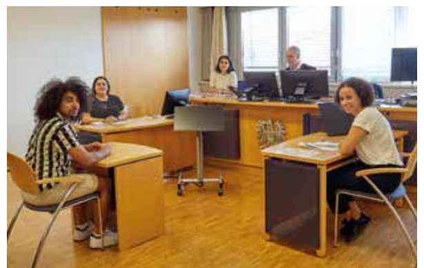
Realitätsnah lernen im Gerichtssaal Bezirksgericht Meidling